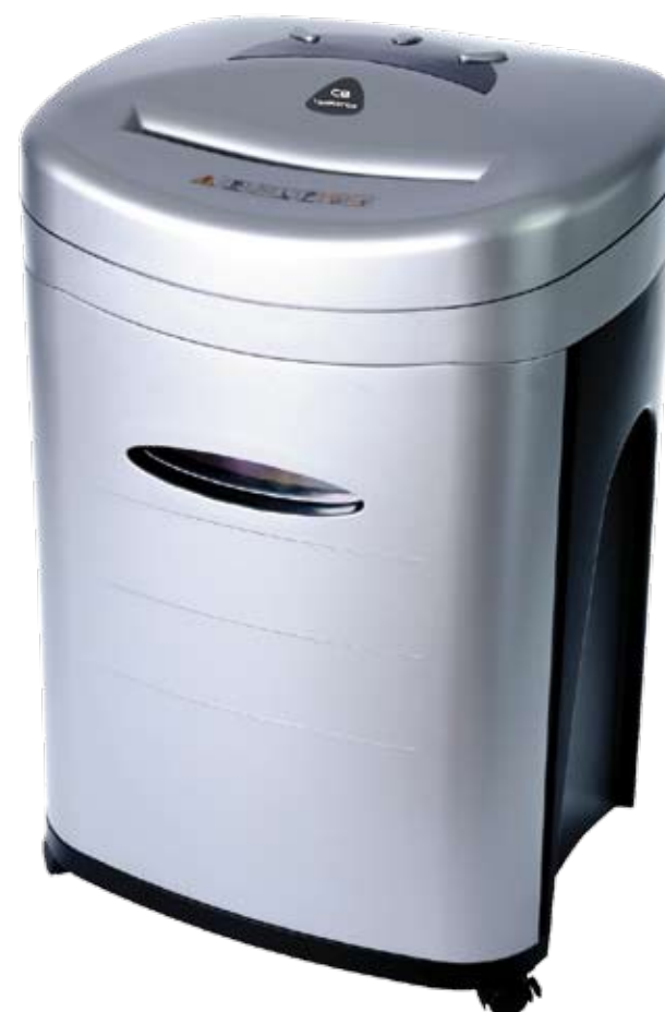
Niszczarka dokumentów i płyt CD

lub olej należy nanieść na kartkę papieru, a następnie włożyć ją do otworu niszczącego.